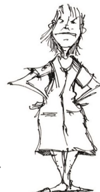
Illustration: Gernot GLASL, 2013 + 2017 Text: Gabriele SCHELLIG

Waun i des Göd het, wos de aum Süvesta vaschossn haum, daun kennt i des gaunze Joa jeden Tog guat essn geh!