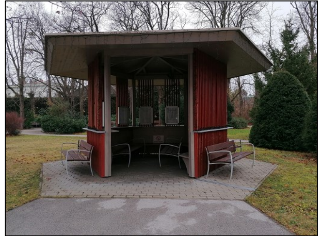
Der kleine Pavillon im Garten des Klinikums offenbarte im Inneren literarische Leckerbissen

Ein kleiner Park vor dem Haus lud zum Spazieren ein, in der Umgebung gab es viel zu entdecken und zu bestaunen.