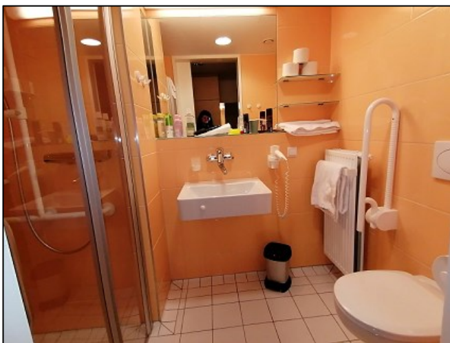
Das Bad war barrierefrei

Die Zimmer waren schön, alles Einzelzimmer mit Balkon, Fernseher, Telefon, Kühlschrank, WLAN, barrierefreies Bad inklusive.