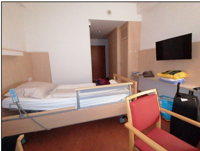
Das Einzelzimmer ließ keine Wünsche offen

Außerdem war ich jeden Tag so geschafft, dass ich den Fernseher zwar aufdrehte, aber bereits um 20.30 Uhr wieder abschaltete, weil mir da schon die Augen zufielen.