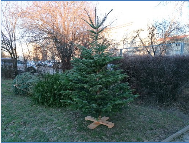
Trauriges Ende der Weihnachtsbäume: lieblos in der Wiese entsorgt

Weihnachten ist wohl endgültig vorbei, wenn die ersten Christbäume in den Wiesen oder auf den Gehsteigen unserer Wohnhausanlage landen. Oft erleiden sie dieses Schicksal schon 2 – 3 Tage nach Weihnachten.