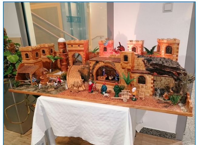
Diese Krippe hat ein ehemaliger Patient des Peterhofs gebastelt und dem Klinikum gespendet

Da es sich beim Peterhof um ein Klinikum handelt, stand die Wiederherstellung der Gesundheit im Vordergrund. Atemtherapie war ein Bestandteil der Behandlung. Ich wollte wieder Kraft bekommen und bekam ein Ausdauer- und Krafttraining verordnet, das es in sich hatte. Ich lernte Nordic Walking, ging schwimmen, machte auch in therapiefreien Stunden freiwillig Übungen und hatte am Anfang einen Muskelkater an Körperstellen, von denen ich nicht einmal geahnt hatte, dass die zu meinem Körper gehören.