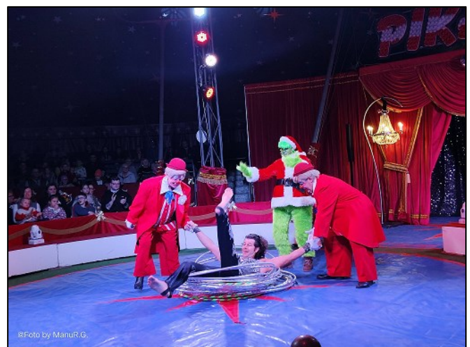
Clowns dürfen in einem Zirkus nicht fehlen, auch der Grinch trieb dort sein Unwesen

Und so wie die beiden strömten auch viele andere Fans des Familienzirkus PIKARD zu den Vorstellungen des Winterzirkus in Korneuburg, um internationale Zirkuskunst made in Austria zu erleben.