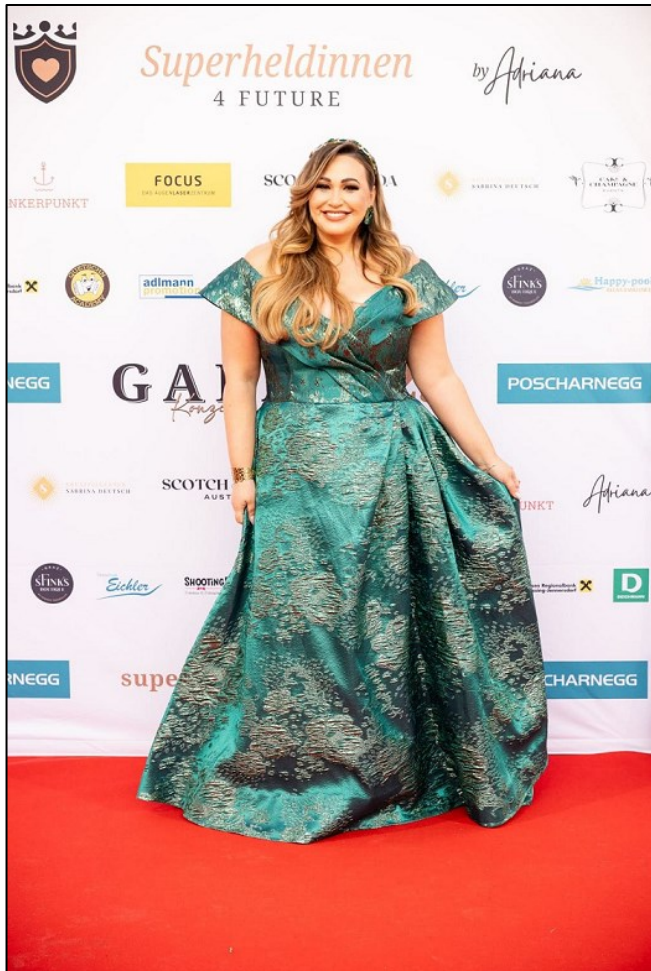
Die sympathische Sängerin - wie viele Frauen eine Superheldin

Es störte sie, dass in der künstlerische Branche Frauen nach wie vor oft im Nachteil und bei Auftritten bei vielen großen Veranstaltungen deutlich in der Unterzahl sind.