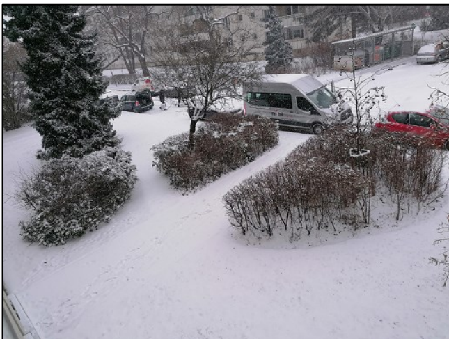
Blick vom Fenster: Gehsteige und Zugänge zur Stiege um 11.30 Uhr noch ungeräumt!

Und wieder scheint Wiener Wohnen bzw. die von dem Unternehmen mit der Schneeräumung beauftragten Firmen vom Winter und dem doch mitunter einsetzenden Schneefall überrascht worden zu sein. Ein paar Mal hat es heuer geschneit und wieder traten Probleme mit der nicht zeitgerecht durchgeführten Räumung in unserer Wohnhausanlage durch die Fremdfirmen auf.