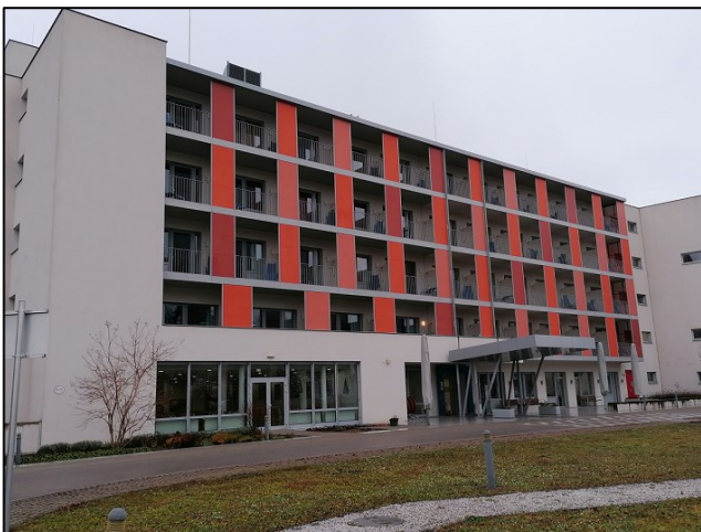
Der Peterhof in Baden - mein Zuhause für drei Wochen

Vorweg gesagt: es ist mir dort so gut gegangen, ich wäre sogar freiwillig noch länger in Baden geblieben.