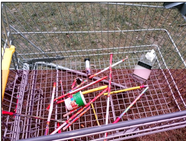
Reste einer lauten Nacht

Mir kam vor, dass vor unserem Fenster Hunderte Euro verpulvert wurden. Die Reste dieser Nacht fanden sich am 1. Jänner wieder in den Wiesen und sogar in den Einkaufswagen, die in unserer Wohnhausanlage überall herumstehen.