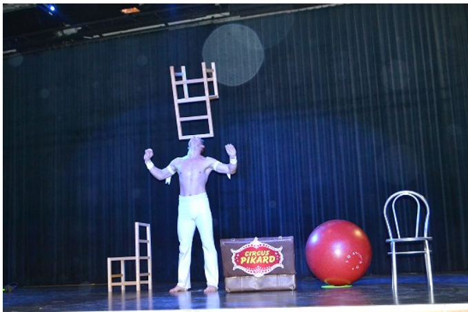
Sein Auftritt faszinierte 2020 unsere Gäste